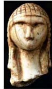
۲۹. ونوس بارسمیوی - [۱۰]