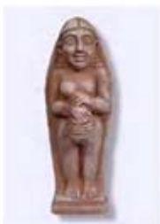
۱۶. سیدوری - سده ۸ ق.م. - [۴۰]