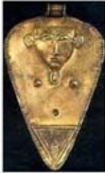
۷۷. هاتور - [۴۸]