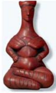
۳۲ تا ۳۳. الاهگان ماری - کرت - [۱۰]