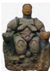
۲۰. الهه باروری - چتل هویوک - [۴۰]