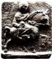
۵۵. اپونا - راین - [۲۳، ص ۲۵]