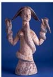
۱۵. هاسی - بابل - [۱۰]