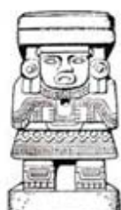
۱۰۴. ایزدبانوی آب - [۳۲، ص ۶۲]