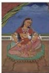
۹۰. پارواتی در حال شیر دادن به گانشا - [۱۰]