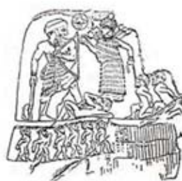
۲. انوبانی نی در برابر اینانا - سر پل ذهاب - [۶ ص ۵]