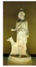
۴۵. بندیس - [۱۰]