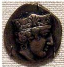
۳۸. سکه با نقش هرا - [۴۵]