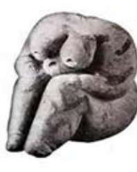
۱۹. الهه باروری - چتل هویوک - [۱۲ ص ۵۲]