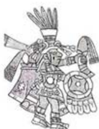
۱۱۰. سنه توتل - [۳۲، ص ۱۷۸]