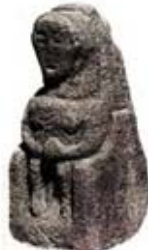
۵۴. الهه باروری - کارونت، ولز جنوبی - [۲۳، ص ۶۳]