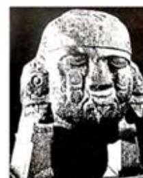
۱۱۲. کویلشاوکی - [۳۲، ص ۱۸۶]