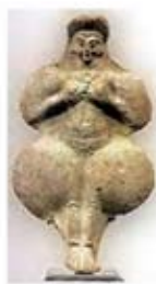
۳. اینانا - [۴۰]