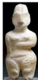
۸. الهه باروری - حسونا - حدود ۶۰۰۰ ق.م. - [۱۳]