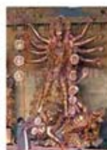
۹۲. دورگا - [۱۰]