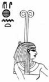
۸۴. مسخت - [۱۰]