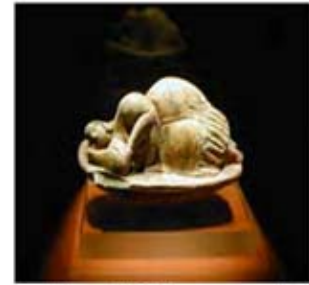
۲۳ و ۲۴. ونوس مالتا - موزه ملی مالت - [۱۲]