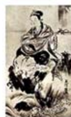
۱۰۰. بنتن - [۳۱، ص ۲۱۸]