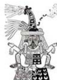
۱۰۶. تلاسوتوتل - [۳۲، ص ۱۷۷]