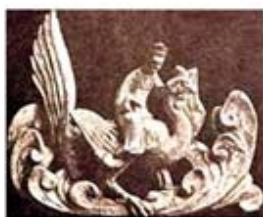
۹۸. فنگ هوآنگ - [۳۰، ص ۶۸]