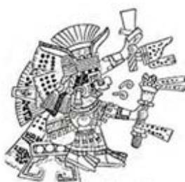
۱۰۹. چالچوتلیکونه - [۳۲، ص ۱۷۰]