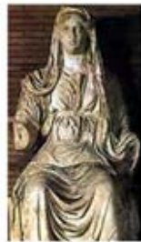
۴۹. سرس - [۲۳]