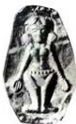
۸۸. الهه زمین - لوریا - [۲۸، ص ۳۵]