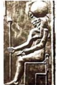
۷۹. مسخت - [۲۷، ص ۱۲۲]