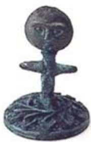
۶۷ و ۶۸ اکولیا - غنا - [۲۹]