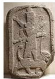
۶. ایشتر - تل برسپ - سده ۸ ق.م. - [۹]