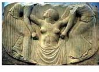
۴۳. حمام افرودیت - [۴۳]