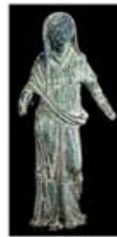
۴۷. جونو - [۴۱]