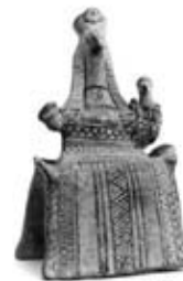
۳۶. مادر و کودک - تاناگرا، یونان - [۹] ۵۵۰ ق.م.