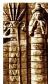
۷. تین لیل - [۱۰]