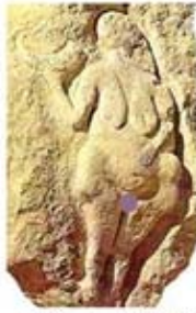
۲۶. الهه باروری - لاسال، دردنی - [۴۳]