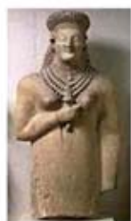
۲۲. بانوی تریکومو - قبرس - سده ۶ ق.م. - [۱۹ ص ۱۶۵]