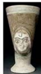
۱۲. جام - اوگاریت - سده های ۱۴ تا ۱۳ ق.م. - [۹]