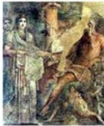
۳۹. نقاشی دیواری هرا - [۴۵]