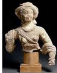
۵۳. دیانا - دورا اوربوس - سده ۲ م - [۹]