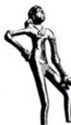
۸۷. دختر رقصان - موهنجودارو - [۲۸، ص ۱۷]