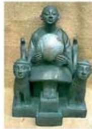
۳۷. گایا - سده ۷ ق.م. - [۱۲]