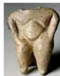
۱۸. الهه باروری - اناتولی - ۶۰۰ تا ۵۵۰ ق.م. - [۱۵ ص ۱۱۳۶]