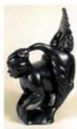
۱۱۷. سذنا - [۱۰]