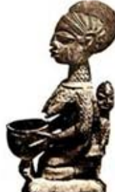
۶۴. تندیس سفالین مادر یا کودک - [۲۴، ص ۱۲۸]