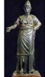
۵۱. مینروا - [۴۱]