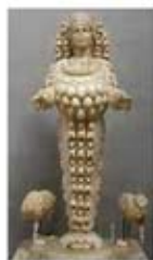
۴۴. آرتیس - [۴۱]