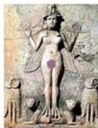
۳. ایشتر - کلکسیون نرمان کولویل - [۴۱]