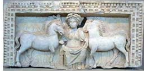
۵۶. اپونا [۴۵]