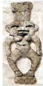
۷۰. به ست - سودان [۴۷]