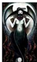
۱۱۶. ارناکوآگساک - [۱۰]