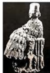
۱۴. الهه باروری - ماری - [۱۱ ص ۴۱]