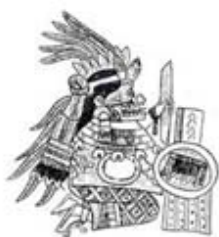
۱۰۵. سیواکواتل - [۳۲، ص ۱۸۹]