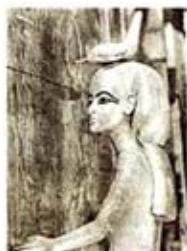
۸۵. ماعت - [۲۷، ص ۱۷۷]