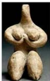
۹. الهه باروری - حلف - حدود ۵۱۰۰ تا ۶۰۰ ق.م. - [۹]