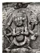
۹۳. کالی نیال - [۱۰]