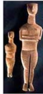
۳۰ و ۳۱. بتهای سیکلادیک - [۲۴] تا ۲۵۰۰ ق.م.