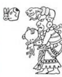
۱۱۳. ایشجل - [۳۲، ص ۲۵۷]