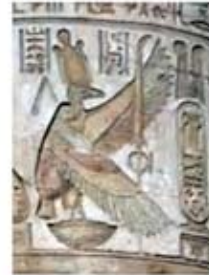
۸۰. نکیت - [۱۰]