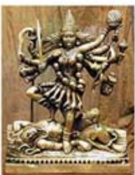
۹۱. کالی - [۱۰]