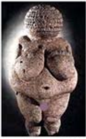
۲۷. ونوس ویلندورف - [۱۴، ص ۳۸]