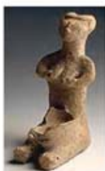
۲۱. الهه باروری - قبرس - هزاره ۴ تا ۳ ق.م. - [۱۸]