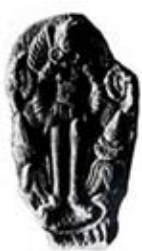
۸۹. ایزدبانوی بالدار - بساره - [۲۸، ص ۴۰]