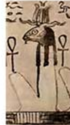
۷۵. تفنوت - [۲۷، ص ۶۷]