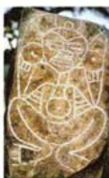
۱۱۴. اناپیرا - پورتوریکو - [۱۰]