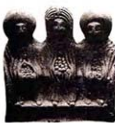
۵۷. الاحگان دنامترس - راین - [۲۳، ص ۶۹]