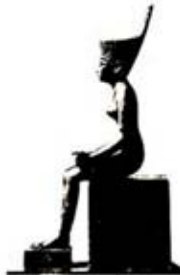
۸۱. نیت - [۲۷، ص ۱۱۸]