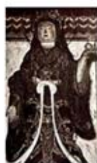
۱۰۱. کیشی جوتن - [۳۱، ص ۳۱]