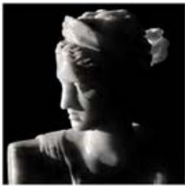
۵۰. دیانا - [۴۵]