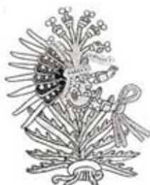
۱۱۱. مایاول - [۳۲، ص ۱۸۱]