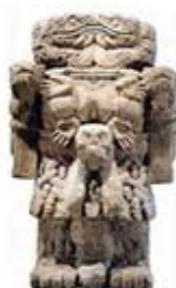
۱۰۸. کواتلیکونه - [۳۲، ص ۱۷۳]