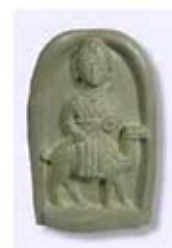
۱۷. اللات - خناسر، سوریه - سده ۱ ق.م. - [۴۰]