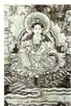
۹۷. تولد کوان بین - [۳۰، ص ۱۵۳]