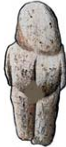
۵۸. ونوس تان تان - مراکش - [۱۰]