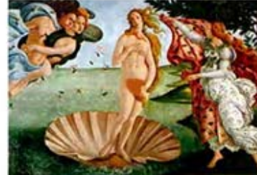
۵۲. تولد ونوس - بوتیچلی - سده ۱۵ م - [۴۶]