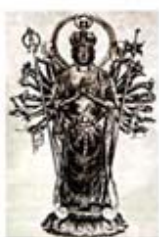
۱۰۲. کوان نون - [۳۱، ص ۹۱]