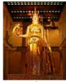
۴۶. آتنا - [۴۱]