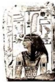
۸۳. سلکت - [۲۷، ص ۱۸۸]