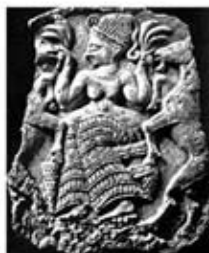
۱۳. نیک کال - اوگاریت - سده های ۱۴ تا ۱۳ ق.م. - [۹]