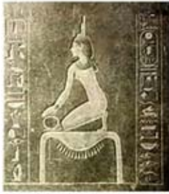
۷۲. ایزیس - [۴۷]